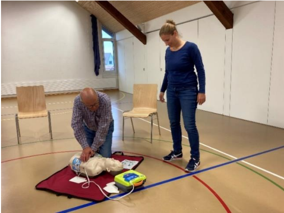
Ein Teilnehmer bei der Thorax-Massage: 100-Mal pro Minute, bei Erwachsenen ca. 5 cm Tiefe