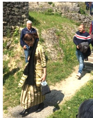
Elisabeth alias Sissi schreitet voran.