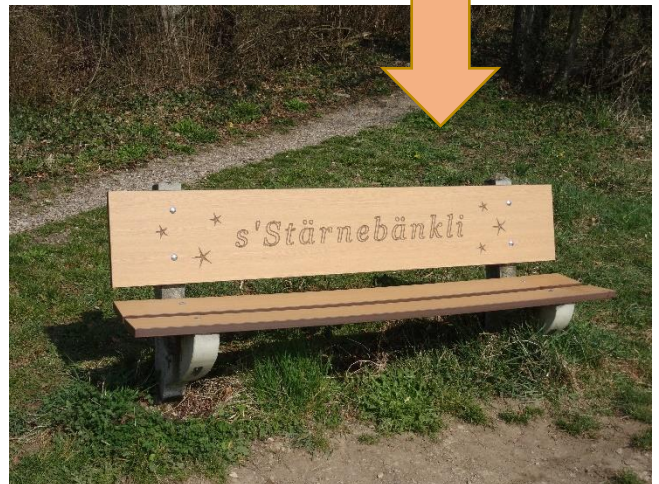
Bank mit Panoramablick Richtung Linnerberg (Geoweg-Station Nr. 11)