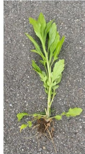
Einjähriges Berufkraut Ende April 2023