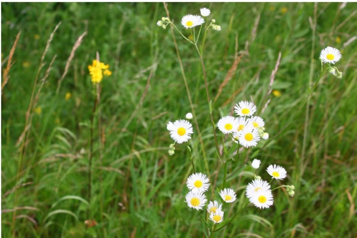
Einjähriges Berufkraut blühend