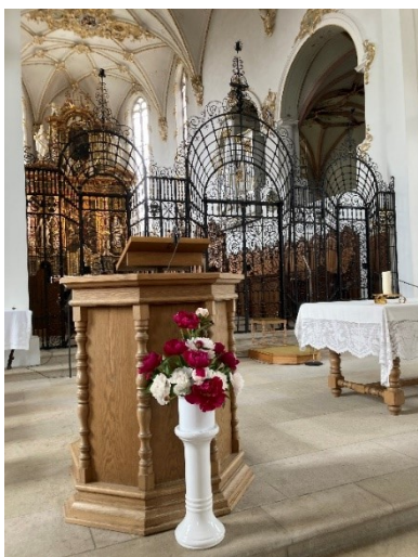
Benediktinerkloster Mariastein. Hochaltar und Grosse Orgel

Eine Regenpause gab uns Gelegenheit für das traditionelle Gruppenfoto. Im Hintergrund sieht man das Benediktinerkloster. Beim Rundgang bewunderten wir die prunkvolle Innenarchitektur der dreischiffigen Basilika mit Deckenfresken, Wandbildern, Hochaltar und der Grossen Orgel. Das Gnadenbild der Mutter vom Trost findet man nach Abstieg über 59 Stufen in der Höhlenkapelle unterhalb der Klosterkirche.