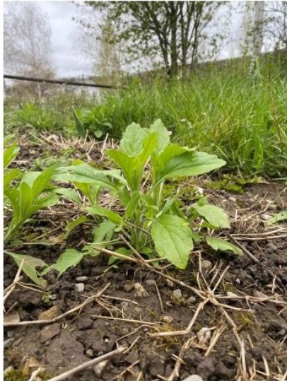
Einjähriges Berufkraut Mitte April 2023

Weitere Informationen rund um invasive Neophyten sind auf der neuen kantonalen Webseite www.ag.ch/neobiota zu finden.