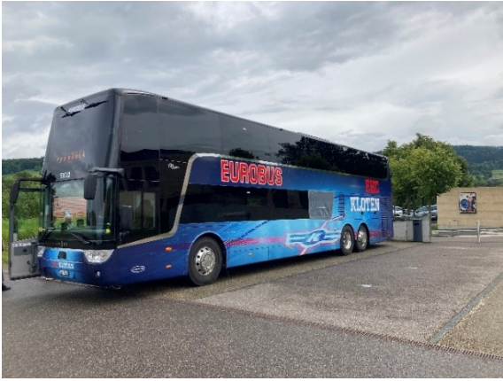
Doppelstöcker: EHC Kloten Mannschaftsbus