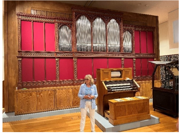
Brittannic-Orgel: Orgel der Britannic, dem Schwes-terschiff der 1912 gesunkenen Titanic