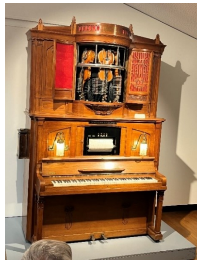
Syphonia Violina-Orchestrion (1908): Selbstspielen-des Klavier und drei integrierte Geigen

Nach einer Stärkung im Museums-Restaurant ging es nach Norden zur Basler Autobahn. In einem Dorf winkten uns junge Eishockey-Fans zu, denn wir waren ja im Mannschaftsbus des EHC Kloten unterwegs.