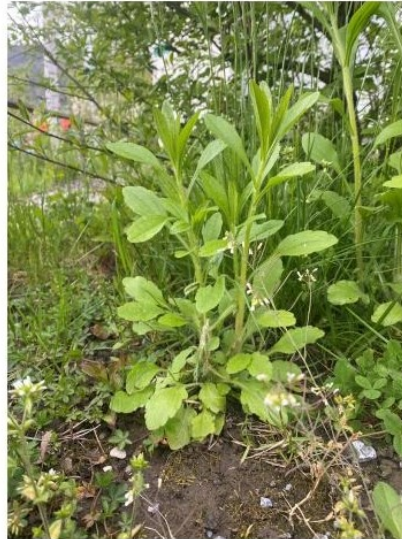
Einjähriges Berufkraut Ende April 2023